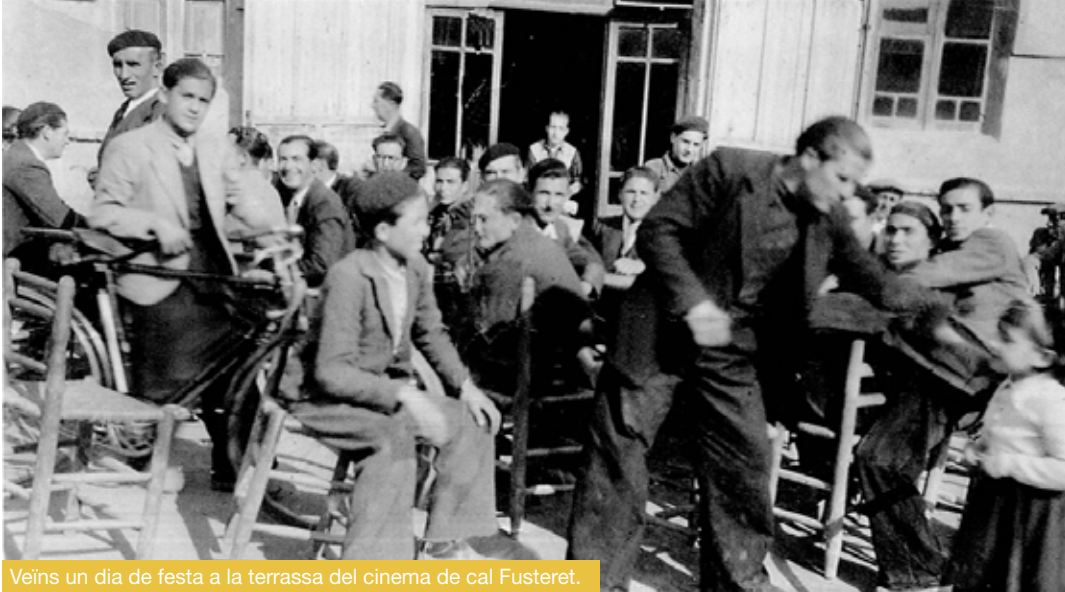
Veins un dia de festa a la terrassa del cinema de cal Fusteret.

Arxiu fotogràfic d'Alcoletge | Equipaments municipals