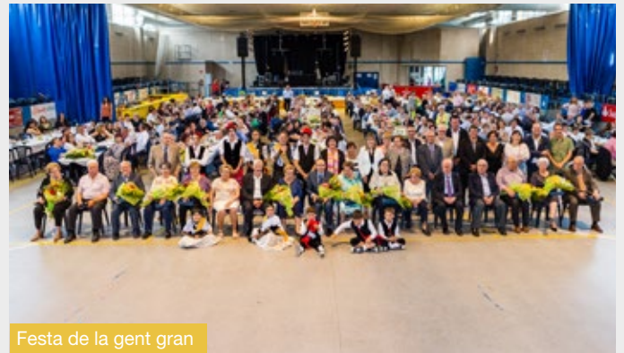
Festa de la gent gran

Esperem poder gaudir, per molts anys, d’aquesta, la NOSTRA LLAR.