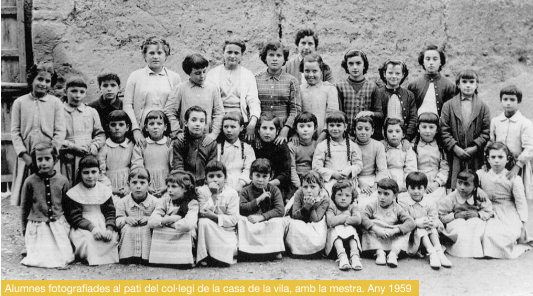
Alumnes fotografiades al pati del col·legi de la casa de la vila, amb la mestra. Any 1959